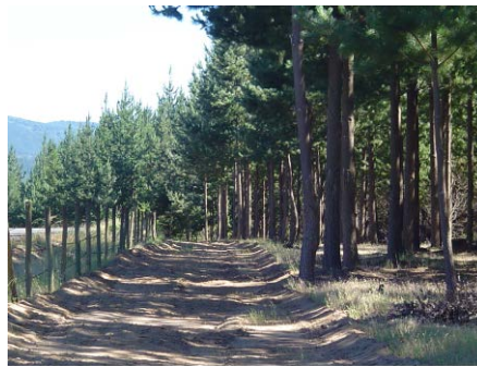
Plantación de Pino insigne

Si se plantan o siembran árboles se habla de plantación forestal, esto es el cultivo artificial de árboles para producir madera, leña o generar otro bien o servicio. Una plantación forestal puede tener árboles de una misma especie o combinaciones de ellas.